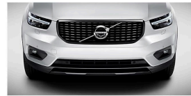
Is the 2019 Volvo XC40 the Best Yet? Edwards (Publicado)