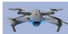
This Cheap Drone Is A Sensation In United States Dronak Pro (Publicado)

Agregue un comentario... Aljondro Mustillo Wanda Eso se llama homopie Pasa de comentario de actualidad Vanguardia no se hace responsable por los opiniones emitidas en este espacio. Los comentarios que así se publican son responsabilidad del usuario que los escribe. Vanguardia se reserva el derecho de eliminar aquellos que ofendan o insulten, que inciten a la violencia o que violen las políticas de privacidad de esta publicación.