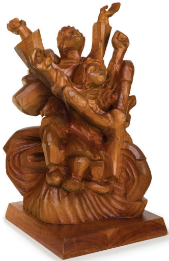
Hernando Parménides Zambrano • VIAJANDO POR COLOMBIA • Talla en madera • Pasto, Nariño

* La estrategia de Arte Urbano Responsable implementada por la Secretaría Distrital de Cultura, Recreación y Deporte de Bogotá tiene como objetivo fomentar la práctica del grafiti en la capital, garantizando la disponibilidad de superficies autorizadas para ser intervenidas, implementando programas de fomento y pedagogía en torno al grafiti y dando a conocer la normativa vigente para este fin.