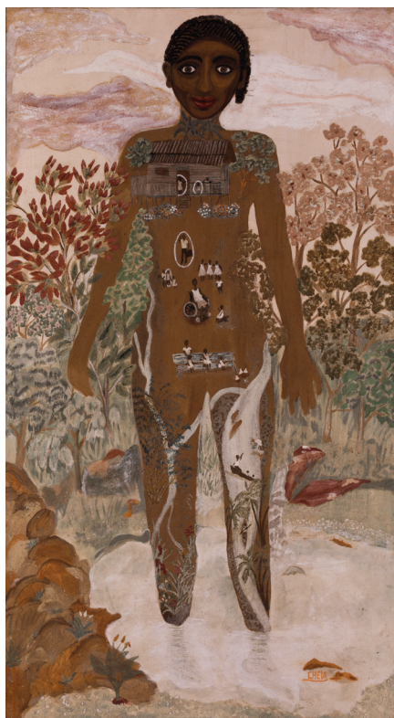
Graciela Viveros Arboleda • MI VIDA • Arcilla y piedra sobre lona • Buenaventura, Valle del Cauca

RESPONSABILIZAN DE LAS OBRAS QUE NO SEAN RECIBIDAS EN LA DIRECCIÓN INFORMADA POR EL ARTISTA. LA FUNDACIÓN BAT NOTIFICARÁ AL ARTISTA AL RESPECTO, SI ESTE NO ATIENDE A LA NOTIFICACIÓN DE QUE LA OBRA NO FUE RECIBIDA EN LA DIRECCIÓN ESTIPULADA, LA FUNDACIÓN BAT PODRÁ DISPONER DE LA OBRA A LOS 30 DÍAS DESPUÉS DE DICHA NOTIFICACIÓN.