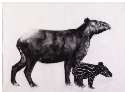
José Ismael Manco • LLAMADO DE MONTAÑA • Carbón vegetal sobre tela • Duitama, Boyacá

La existencia en Colombia, de páramos, sierras, selvas, lagos, desiertos, ríos, llanos y mares ha sido claramente provechosa para la diversidad tanto natural como cultural, ya que la diversidad cultural de la especie humana se encuentra estrechamente asociada con las principales concentraciones de biodiversidad existentes.