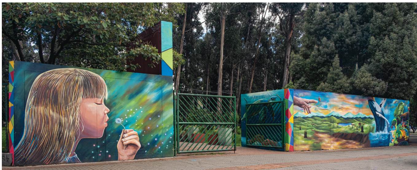
Alejandro Alzate García • "TERRITORIOS" • Mural • Bogotá

experimentales, ensamblajes realizados en materiales diversos. Las dimensiones de estas obras no deberán exceder de 60 cm 2 de base y 1 m de altura; y su peso no debe ser mayor de 30 Kg. Dentro de estas márgenes, hay flexibilidad para que las medidas puedan corresponder indistintamente al alto y a la base. Los materiales utilizados y la técnica serán libres.