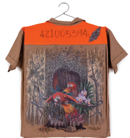
César Augusto Rueda • LA VIDA NO SE DETIENE • Óleo sobre tela • Floridablanca, Santander

a concursar en el VIII Salón BAT de Arte Popular serán objeto de una investigación sobre el arte popular colombiano. Con la firma del formato de inscripción a la convocatoria, el artista declara y acepta que está cediendo a favor de la Fundación BAT el derecho de reproducción de la obra, sin límite territorial, la cual comprende la explotación por sí o por terceros del material en cualquier formato o soporte y por cualquier sistema, procedimiento o modalidad existentes y/o conocidos o no en la actualidad, con carácter gratuito o mediante contraprestación, para la promoción y divulgación cultural de las obras, durante el mismo término de protección y duración establecido por la legislación de la República de Colombia a favor del autor. En cualquier caso, las obras siempre serán expuestas o reproducidas, reconociendo los derechos morales de cada artista, indicando su nombre, nacionalidad y fecha de creación.