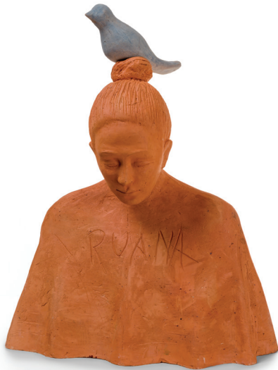
Santiago Rodríguez Ruiz • MUJER CON RUANA • Modelado en arcilla • Ráquira, Boyacá

en el VIII Salón BAT de Arte Popular. Se deja claramente establecido y así lo acepta el artista, que con el recibo del premio la obra pasará a ser parte de la colección de arte popular de la Fundación BAT: